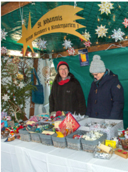
Stand des Kindergartens und der Jungen Kantorei

Durch den Umbau des Gemeindehauses und dem damit verbundenen Umzug in das Mesnerhaus findet dieses Jahr kein Verkauf der beliebten Erzeugnisse der Bruckberger Werkstätten statt.