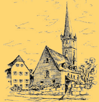
ST. JOHANNIS Burgfarnbach - Atzenhof - Unterfarnbach