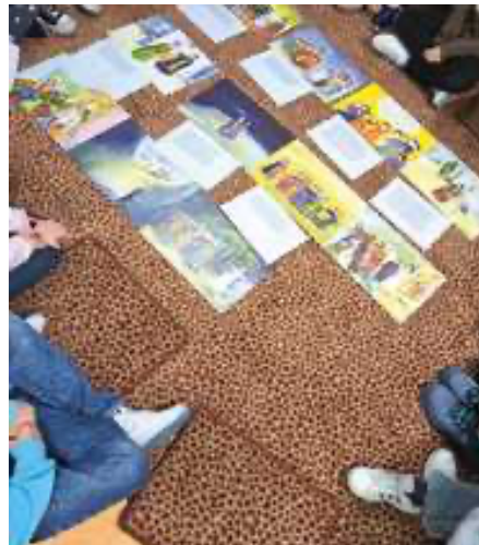
Beim kreativen Arbeiten

er Gott in seinem Leben gespürt? Und wie ist es bei mir? Neben dem vielen Nachdenken hatten die Kinder auch die Gelegenheit, ihre Gefühle und Gedanken kreativ auszudrücken. Dabei sind wunderbare Kunstwerke entstanden: Zeitperlenketten, Gefühlsuhren, Bodenbilder oder Zeitgutscheine.