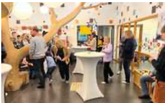
Treffpunkt alter und neuer Bekannte

Wir hatten am Samstag, den 25. November, dies zum Anlass genommen und mit einem Gottesdienst gefeiert.