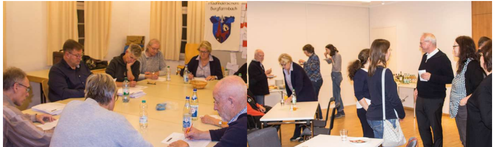
Auszählung der Stimmzettel