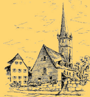
ST. JOHANNIS Burgfarnbach - Atzenhof - Unterfarnbach