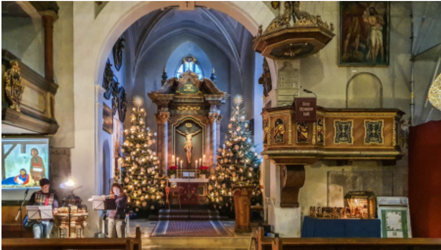
Mini-Gottesdienst mit Jugendband