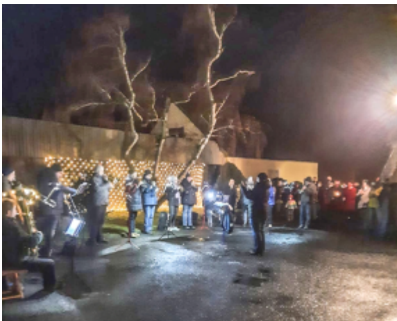
Bläsermusik in romantischer Atmosphäre

Posaunenchor bereichert Mini-Gottesdienst