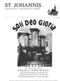
Titelseite der Monatsgruß-Ausgabe vom Oktober 2001