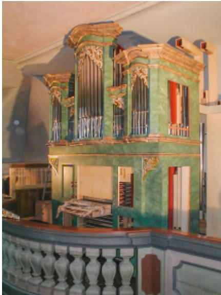
Während des Aufbaus: Deutlich zu sehen, die geknickten über 4 Meter langen Orgelpfeifen, die Spieltisch wird gerade montiert.

Kaum zu glauben! Unsere neue Orgel ist nun schon wieder 20 Jahre alt.