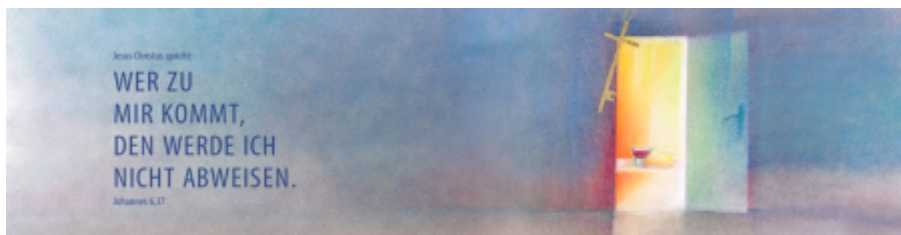
(Motiv von Stefanie Bahlinger, Mössingen, www.verlagambirnbach.de )