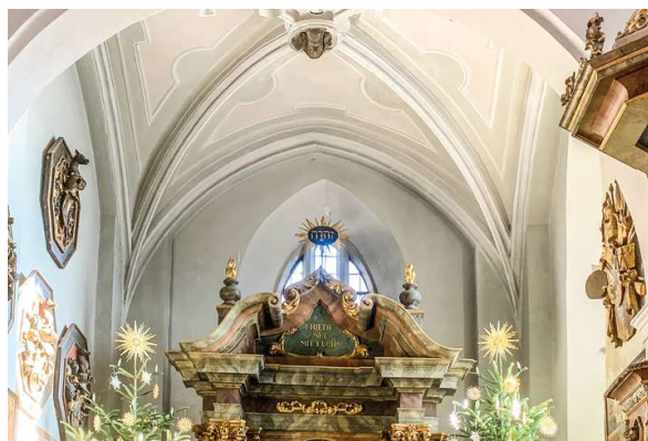
Offene Altarspitze in der St. Johanniskirche mit dem Jahwe-Tetragramm, das bedeutet: Ich bin, der ich bin bzw. Ich werde sein, der ich sein werde.

Das ist ganz wichtig: Es gibt – mindestens – zwei Grundformen, wie wir unser Leben gestalten können. Die eine Grundform geht so: Hauptsache, ich komme irgendwie durch. ohne Besonderheiten, einfach normal, tagein, tagaus, wie es üblich ist, Hauptsache, ich habe etwas Spaß im Leben und nach mir die Sintflut. Eine sehr einfache, einfältige Lebensweise. Der Liedermacher Wolf Biermann beschreibt sie so: „Das kann doch nicht alles gewesen sein.“ Und dann zählt er auf: „Das bisschen Sonntag und Kinderschrein, das bisschen Auto und Führerschein, die Überstunden, das bisschen Kies und abends in der Glotze das Paradies. Das muss doch noch irgendwo hingehen. Da muss doch noch Leben ins Leben. Eben!“