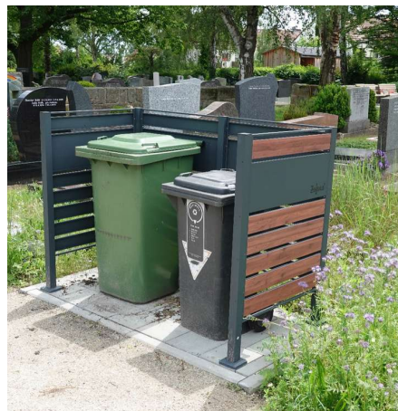
Abfallbehälter in der Einhausung