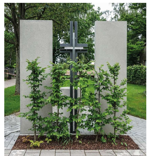
Kreuz am neuen Urnenfeld

Neben der Aussegnungshalle wurde ein neues Urnenfeld angelegt, damit wir auf unserem Friedhof auch anonyme bzw. teilanonyme Urnenbestattungen anbieten können. In den vergangenen Jahren wurde verstärkt nach dieser Möglichkeit gefragt. Das Feld bietet Platz für 110 Urnen, an den beiden Stelen neben dem Kreuz werden Schilder angebracht, die auf die hier Bestatteten hinweisen. Die Bepflanzung sowie die Ruhebänke umrahmen das ganze Feld.